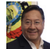
ЛУИС АЛЬБЕРТО АРСЕ КАТАКОРА Президент Боливии

«Это Форум, который объединяет и собирает лидеров Запада, глобального Юга, Востока. Это та точка, где встречается вся Евразия. Индонезия рассматривает данное участие в качестве возможности завоевать доверие, заключать сделки в условиях все более усложняющейся геополитической обстановки, сделки, которые пойдут на пользу всем нам, которые обеспечат совместный успех».