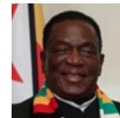
ЭММЕРСОН ДАМБУДЗО МНАНГАГВА Президент Зимбабве