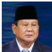
ПРАБОВО СУБИАНТО Президент Республики Индонезия