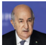
АБДЕЛЬМАДЖИД ТЕББУН Президент Алжирской Народной Демократической Республики